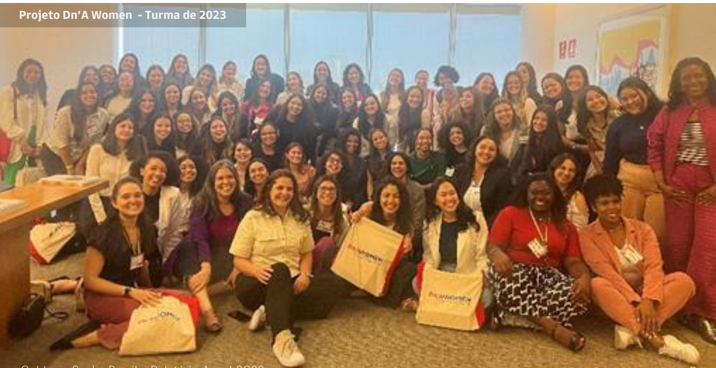
Projeto Dn'A Women - Turma de 2023

O Dn'A Women - Develop and Achieve é um projeto criado pelo Conglomerado em parceria com BNP Paribas, Deutsche Bank e UBS, com o objetivo de capacitar e qualificar estudantes universitárias mulheres cisgênero e transgênero, residentes no Estado de São Paulo, para apoiar e promover o desenvolvimento de suas carreiras e conhecimentos básicos sobre o mercado financeiro. A turma de 2023 contou com a participação de 60 estudantes que participaram de aulas presenciais e online de agosto a dezembro, com conteúdo sobre empoderamento feminino, liderança, finanças pessoais, mercado financeiro e comunicação.